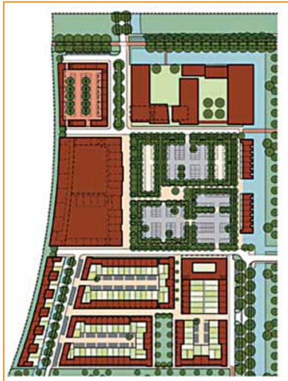
Het buurtschap 'De Ontmoeting' met rechtsboven het Ontmoetingshuis en rechtsonder het plein met daaronder het Kloppend Hart Huis. Het winkelcentrum is midden links gelegen.

In het deelplan Buurtstede zal in het buurtschap De Ontmoeting het 'Ontmoetingshuis' en het 'Kloppend Hart Huis' gerealiseerd worden. Samen met het winkelcentrum moet dit het bruisende centrum van de wijk worden. In 2010 wordt gestart met de bouw van dit centrum. Dit lijkt nog ver weg, maar op alle fronten is men druk bezig met de voorbereidingen voor de bouw van deze voorzieningen in het centrum van Veenendaal-oost.